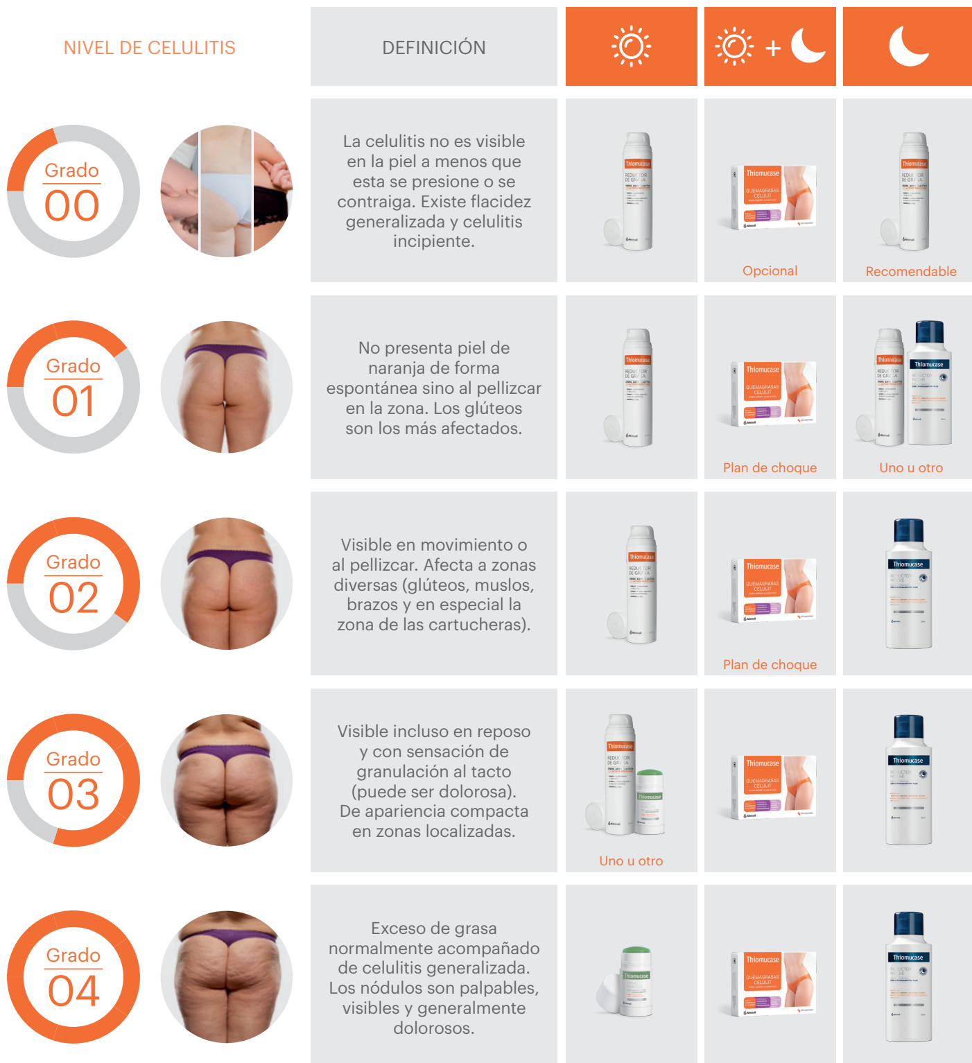
TABLA DE RECOMENDACIÓN FARMACÉUTICA